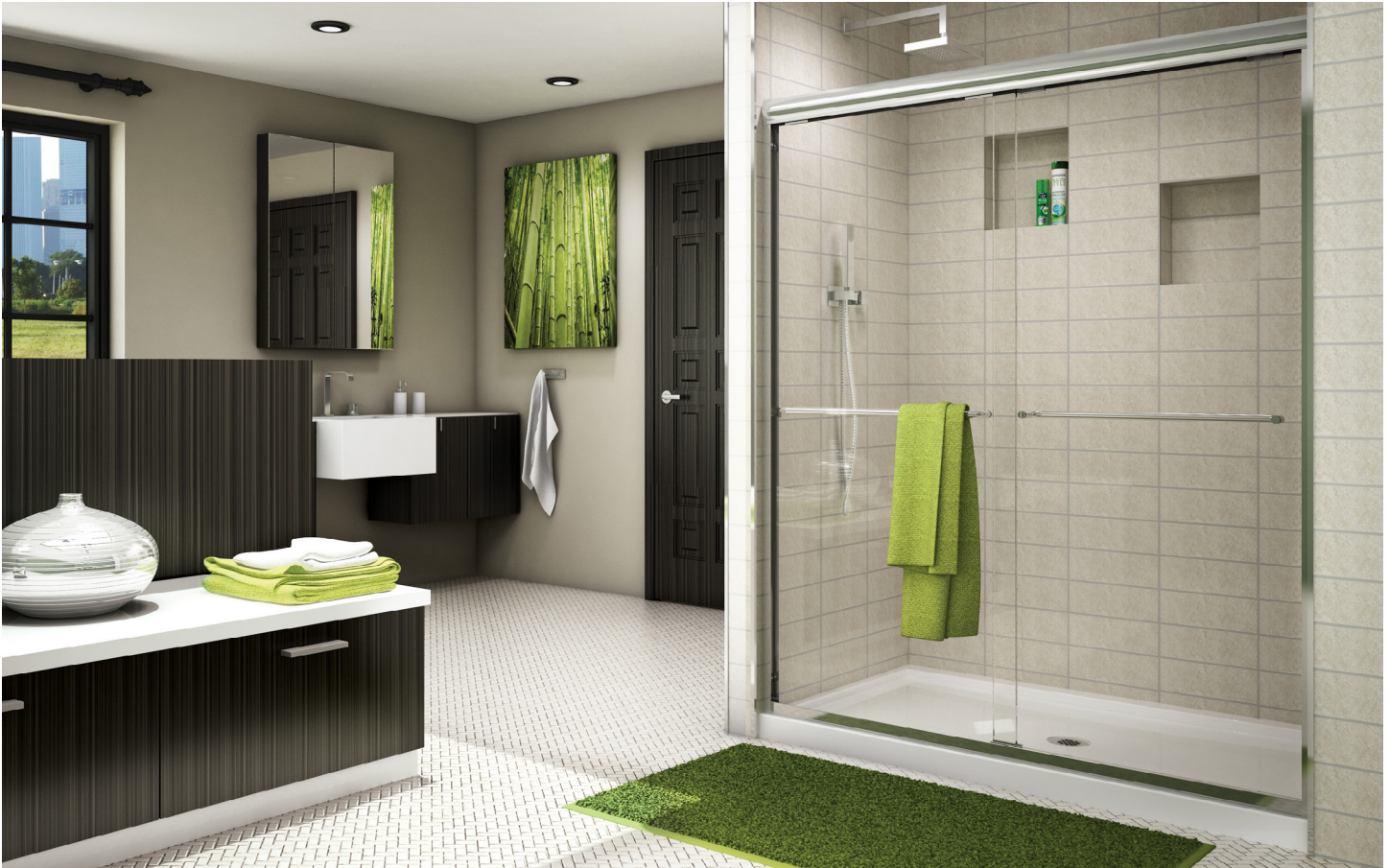
Model shown / Modèle présenté : Cordoba In-line Bypass / Cordoba en alcôve bidirectionnel (CS160-11-40)

Semi-frameless in-line sliding shower doors / Portes coulissantes pour douche avec cadre partiel