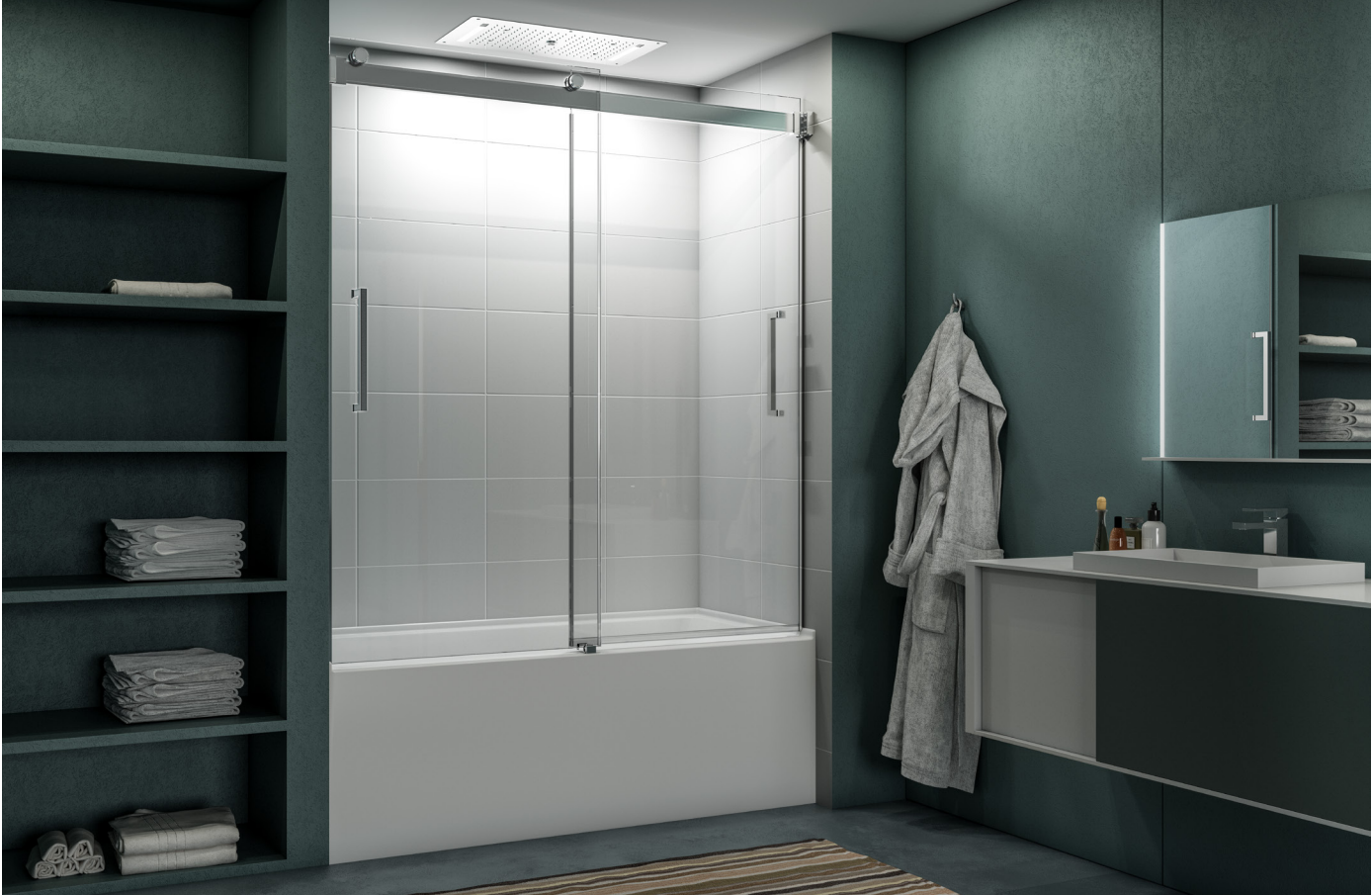
Model shown / Modèle présenté : Mercury Bypass Tub Enclosure / Mercury bidirectionnel pour baignoire (NMT60-11-40)

Frameless sliding tub doors / Portes coulissantes bidirectionnelles sans cadre pour baignoire