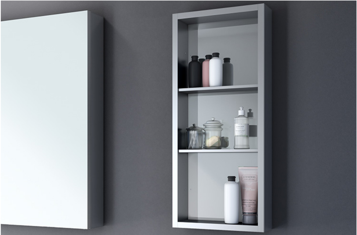
Model shown / Modèle présenté : MCND1230-11